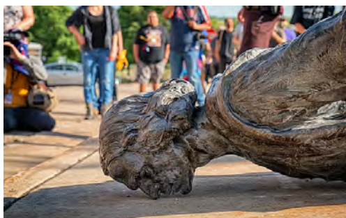
Czy to koniec kolonializmu? / Pomnik Krzysztofa Kolumba znajdujący się przed Kapitołem stanu Minnesota po obaleniu go przez grupę kierowaną przez członków Ruchu Indian Amerykańskich (10 czerwca 2020). (CC BY 2.0)