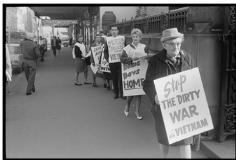
Dekolonizacja / Protest przeciwko wojnie w Wietnamie w Sydney w Australii (1965). Wojna była konsekwencją podziału Indochin – byłej francuskiej kolonii. (CC BY 4.0)