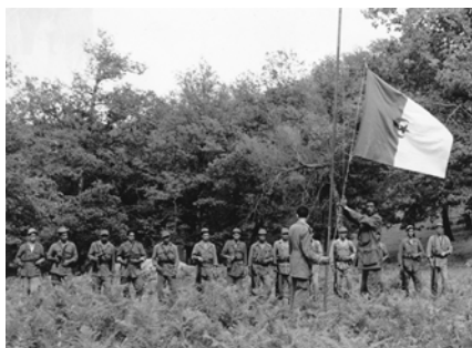
Dekolonizacja / Żołnierze Narodowej Armii Wyzwoleńczej podczas algierskiej wojny o niepodległość (1958). (CC BY 4.0)