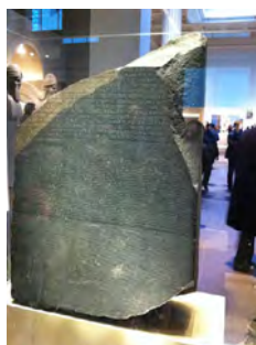
Czy to koniec kolonializmu? / Kamień z Rosetty znajdujący się w British Museum w Londynie. Został przejęty przez brytyjskie wojska kolonialne. Egipt domaga się jego zwrotu jako dziedzictwa narodowego. (CC BY 2.0)