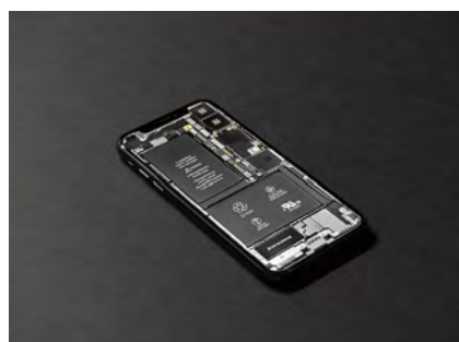
Czy to koniec kolonializmu? / Elektronika i baterie są nadal wytwarzane z metali pochodzących z kolonialnych kopalń znajdujących się na całym świecie.