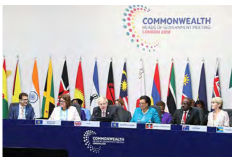
Dekolonizacja / Spotkanie ministrów spraw zagranicznych Wspólnoty Narodów w Londynie (2018). (CC BY 2.0)