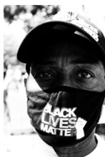
Czy to koniec kolonializmu? / Osoba protestująca w masce Black Lives Matter (2020).